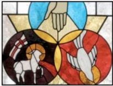
Drie-enige God Vader-Zoon-Geest